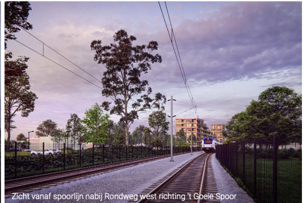
Zicht vanaf spoorlijn nabij Rondweg west richting 't Goeie Spoor