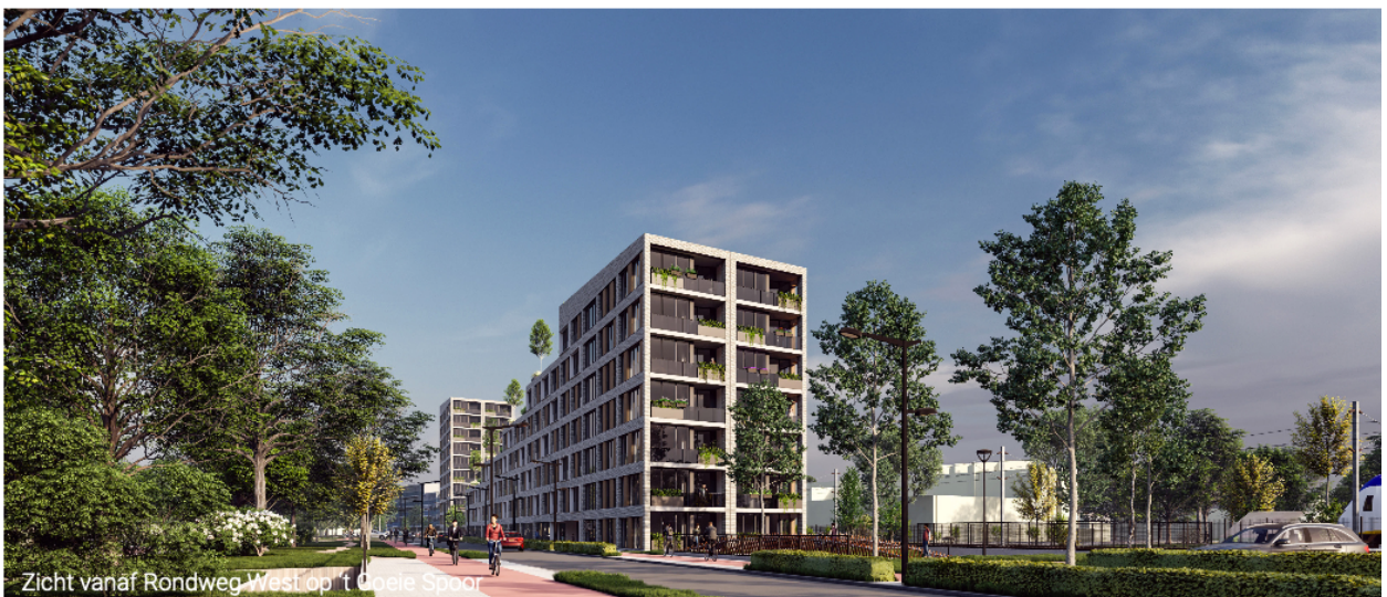
Zicht vanaf Rondweg West op 't Goeie Spoor