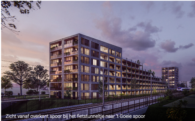
Zicht vanaf overkant spoor bij het fietstunneltje naar 't Goeie spoor