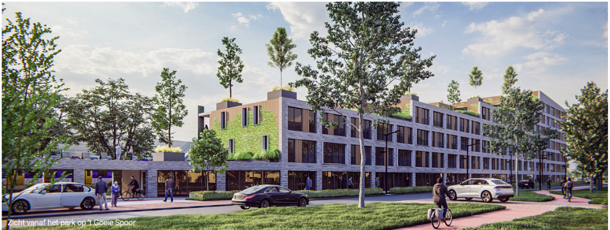
Zicht vanaf het park op 't Goeie Spoor